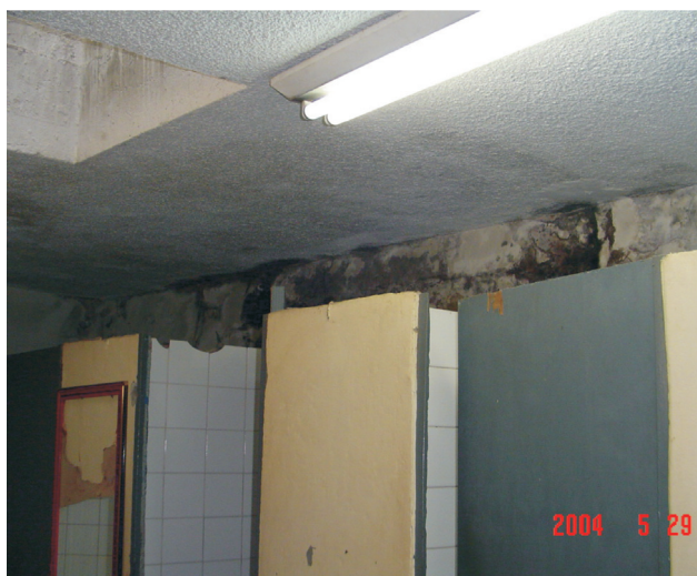
Figura. 03 – Problemas de Infiltração

Quanto a Manutenção do Edifício: adentrando é possível encontrar patologias como vidros e pisos quebrados, pintura descascada, rachaduras e jardins mal cuidados. Segundo Paulo de Faria Castro (antigo responsável pelo Terminal Rodoviário), a parte hidráulica está com problemas de infiltração e a elétrica está irregular (Ver Fig. 03 e 04).