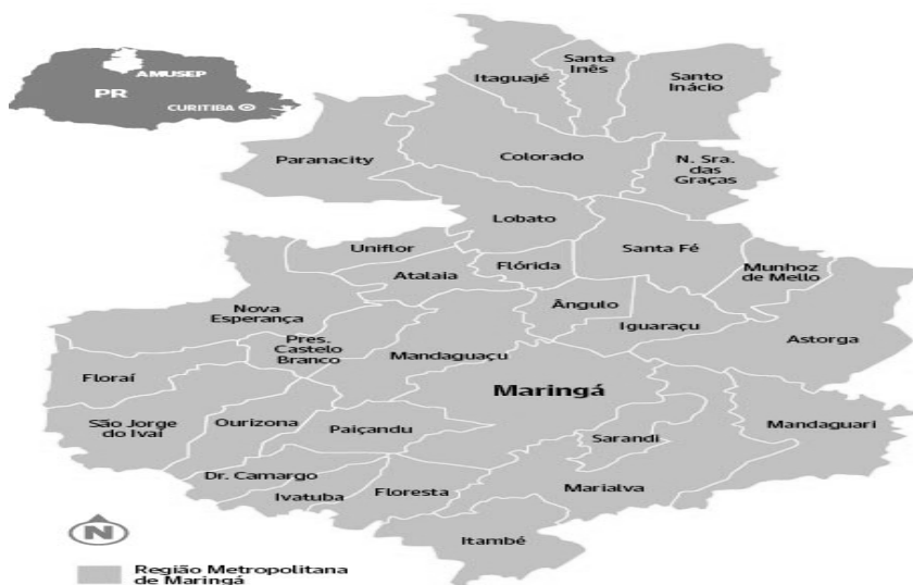
Figura 1: Mapa geopolítico da região da AMUSEP e da região metropolitana de Maringá