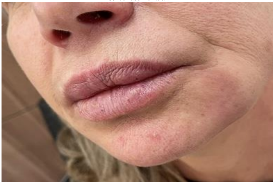
Figuras 1 - placas eritematosas infiltradas na região do lábio superior e inferior e região sulconasomental.