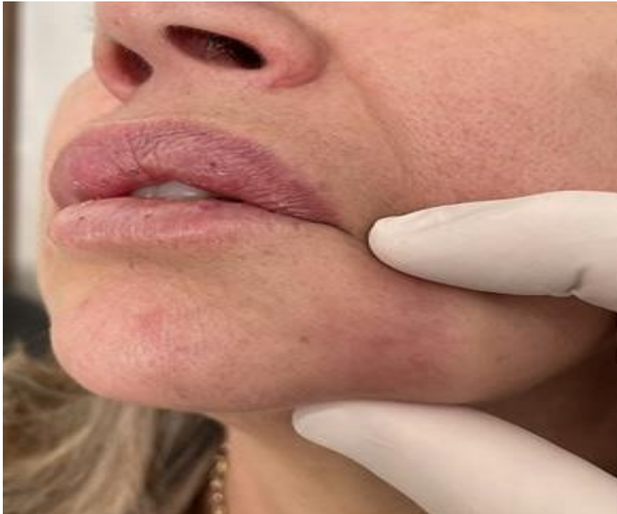
Figuras 2 - placas eritematosas infiltradas na região do lábio superior e inferior e região sulconasomentual.