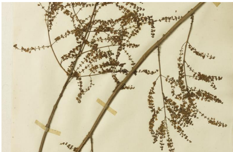
Figura 1: Exemplar da espécie Tetradenia riparia

principalmente utilizado como planta ornamental, especialmente no Brasil (Catálogo da vida, 2020; Panda et al. , 2022).