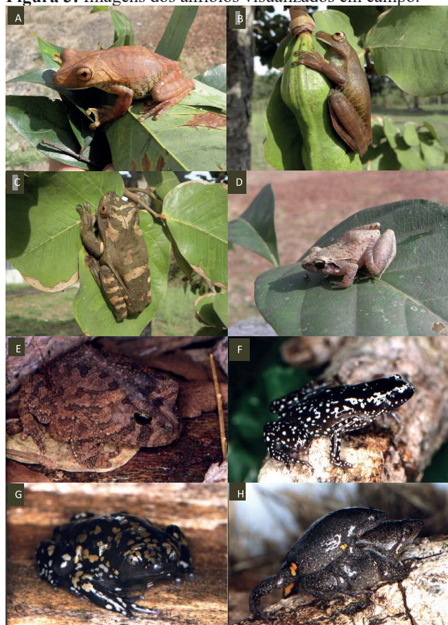
Figura 3: Imagens dos anfíbios visualizados em campo.

Legenda: A) Hypsiboas multifasciatus , B) Hypsiboas faber , C) Hypsiboas crepitans , D) Physalaemus cuvieri , E) Proceratophrys concavitympanum , F) Chiasmocleis albopunctata , G) Dermatonotus mulleri , H) Elachistocleis ovalis , em amplexo.