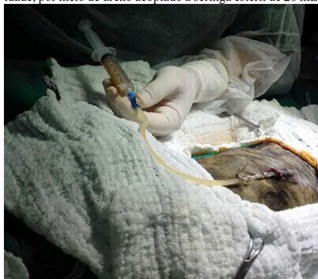
Figura 3: Conteúdo purulento sendo removido da cavidade torácica esquerda de macho canino, mestiço, de um ano de idade, por meio de dreno acoplado a seringa estéril de 20 mL.

O animal foi submetido à novo procedimento cirúrgico para colocação de um dreno torácico. Após a fixação do dreno (Figura 3), foram removidos 30mL de secreção purulenta, e uma pequena quantidade de conteúdo sanguinolento (Figura 3), e, posteriormente, realizou-se a lavagem da cavidade com solução de solução fisiológica aquecida estéril, injetando-se e removendo-se um total de 300 mL para a limpeza da cavidade.