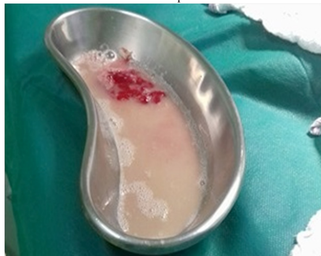
Figura 4: Aspecto do conteúdo removido da cavidade torácica esquerda de macho canino, mestiço, de um ano de idade, desenvolvido três dias após a remoção de corpo estranho esofágico. Observa-se conteúdo purulento com coágulos de sangue em cuba cirúrgica. Tal conteúdo foi removido por dreno torácico da cavidade torácica esquerda.