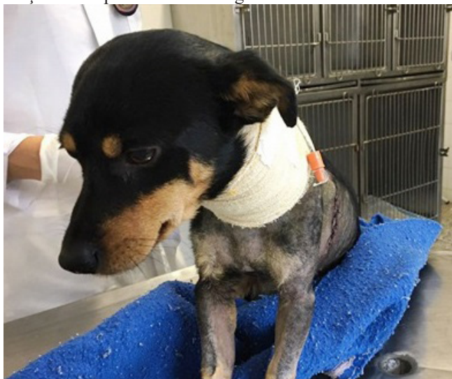
Figura 2: Macho canino, mestiço, de um ano de idade, com sonda esofágica para alimentação no pós-operatório de remoção de corpo estranho esofágico.

ondansetrona 2 (0,2 mg/kg) a cada 12h, cloridrato de metoclopramida 3 (2 mg/kg) a cada 8h, e tratamento analgésico com cloridrato de tramadol 7 (4 mg/kg/QID). Também se administrou morfina 8 no primeiro dia de pós-operatório, na dose de 0,5 mg/kg a cada 2h.